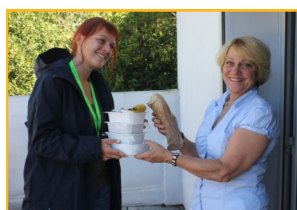
LIVRAISON DE REPAS

Notre service handicap accompagne les personnes en situation de handicap dans les actes essentiels de la vie quotidienne (aide au lever, aide à l'alimentation,...) mais aussi à la vie sociale (promenades, loisirs,...) en veillant à préserver leur autonomie.